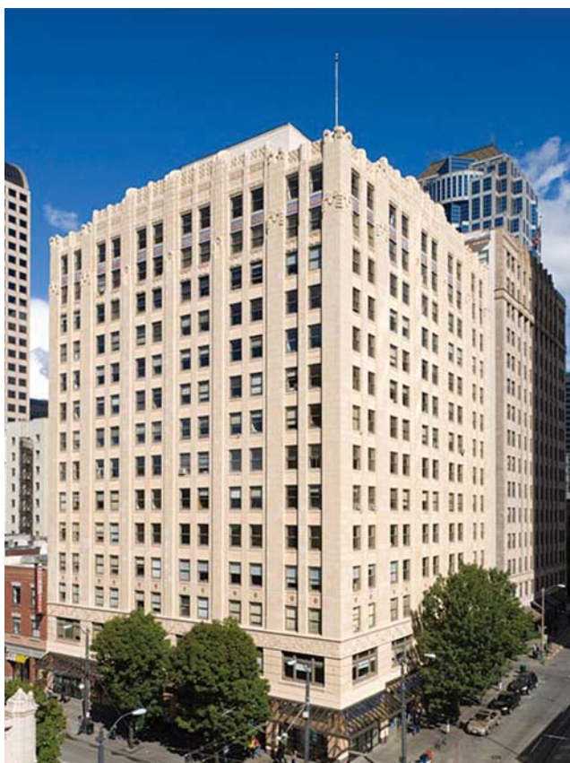
Главное управление фирмы «Риббонд» расположено в центре Сиэтла, в историческом здании, которое получило Золотой сертификат системы LEED (система «Лидерство в энергетическом и экологическом проектировании»).

— Известно, что Ваши идеи армирования реставраций, основанные на биомеханике естественного зуба, легли в основу создания Академии